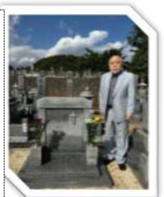
教会第二墓地・永松師